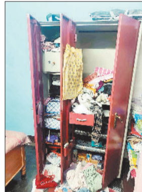
सूनेपन का फायदा उठाकर अज्ञात चोरों ने क्वाटर के मुख्य द्वार का ताला तोड़कर अंदर प्रवेश कर दो अलमारीयों के लॉकर को तोड़कर